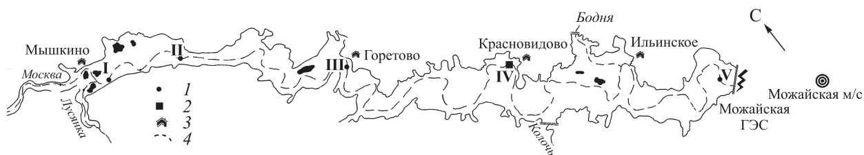
Рис. 1. Схема Можайского водохранилища и расположение станций гидрологической съемки над затопленным руслом р. Москвы.

I–V — станции. 1 — пункты отбора проб; 2 — пункт постановки плавучей камеры; 3 — населенные пункты; 4 — затопленная русловая сеть.