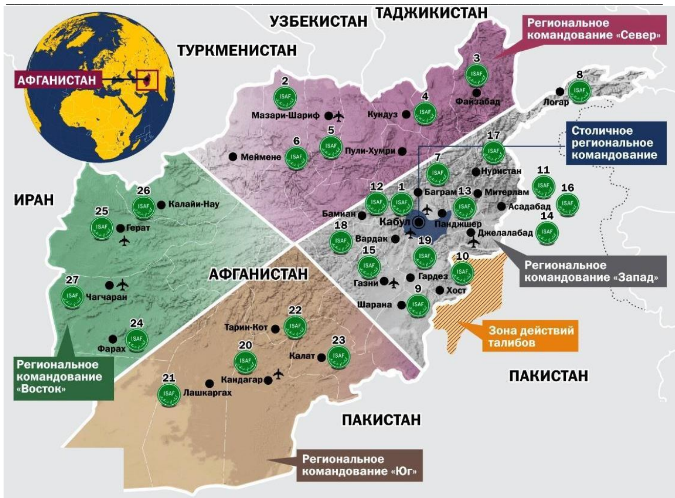
Схема расположения военных баз западной коалиции в Афганистане