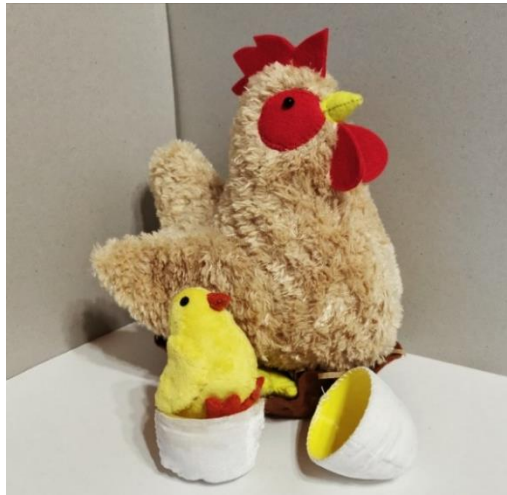
Рисунок 1. Готовая детская системная игрушка «Курочка с цыпленком» (разобранный вид)

Вторым составляющим элементом комплекта является цыпленок, который имеет меньший