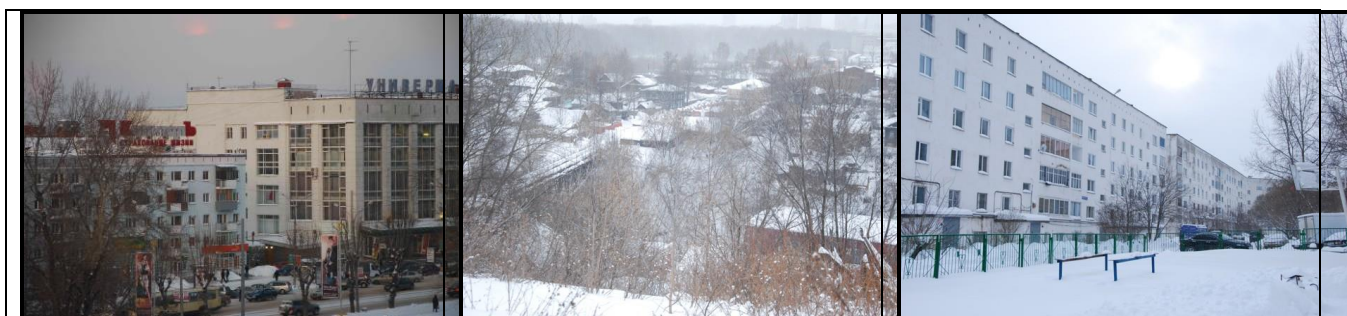
Рис.1. Центр города, вид на ул.

В районах хорошо развита инфраструктура. В каждом есть кинотеатр, дворец культуры, стадион, парк, множество кафе, рестораны. Их жители часто осознают себя не жителями Перми, а жителями отдельного города. Жители Гайвы в шутку называют свой район Федеративной Республикой Гайва, хотя обижаются, когда их не причисляют к городу. Помимо самодостаточности, следует отметить, что районы не только «сами в себе», но также являются центром притяжения для некоторых районов соседних районов.